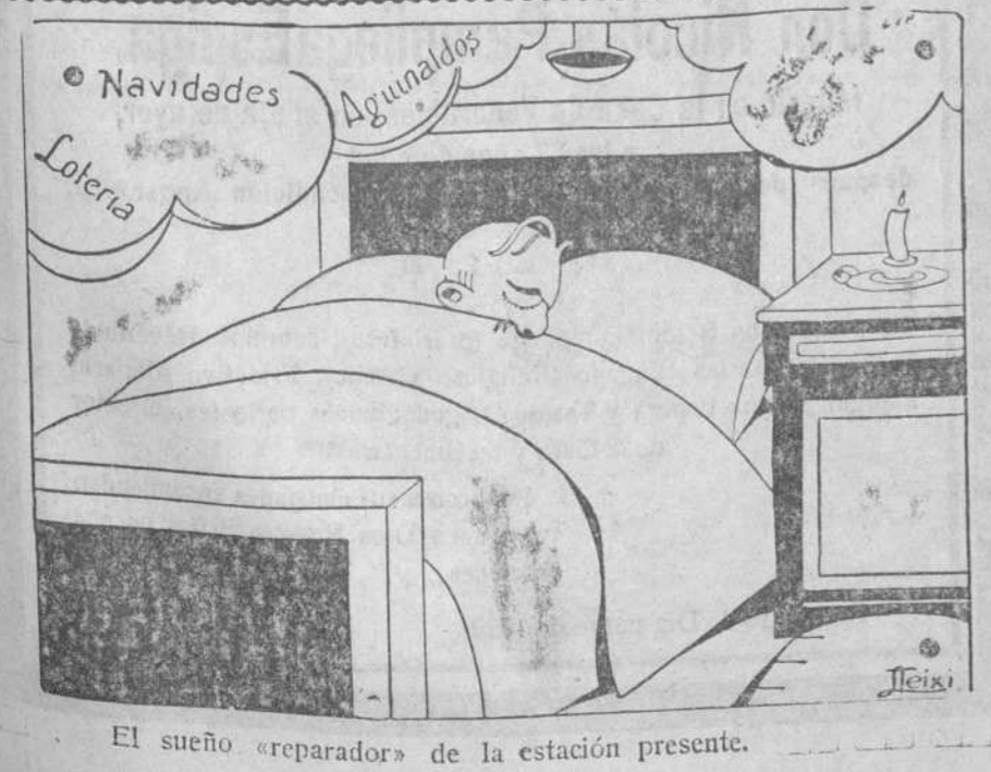
El sueño reparador de la estación presente.

El señor delegado de Hacienda ha hecho los siguientes señalamientos para el pago de la mensualidad. Día 18.—Tropa mensual y críes pensionadas. Día 19.—Jefes y oficiales retirados del Ejército y Marina y jubilados de todos los Ministerios. Día 20.—Monopio militar, civil, remuneratorias y cesantes. Día 21 y 24.—Todas las nóminas y los que cobran por Habilitado.