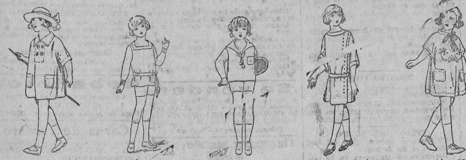
300 modelos diferentes en vestidos y trajecitos para niños, en percal, batista, hilo y seda, desde 2'50 pesetas vestido a 35