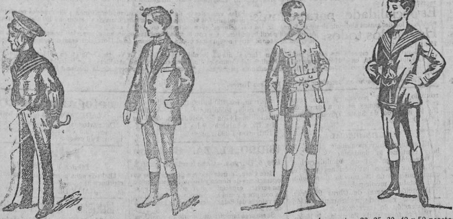
Modelos de trajecitos en diferentes formas y estilos para primera comunión y formas de sport, a 20, 25, 30, 40 y 50 pesetas

Gran casa de tejidos, pañería y confecciones de caballero, señora y niños