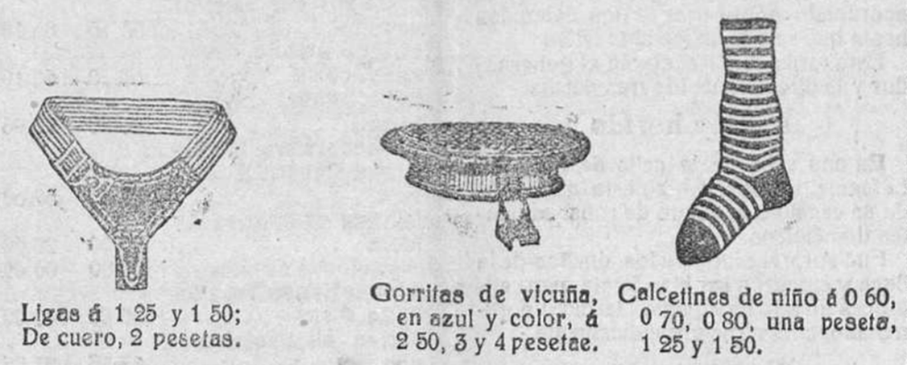
Ligas á 1 25 y 1 50; De cuero, 2 pesetas. Gorritas de vicuña, en azul y color, á 2 50, 3 y 4 pesetas. Calcetines de niño á 0 60, 0 70, 0 80, una peseta, 1 25 y 1 50.

SOCIEDAD ESPAÑOLA DE COMERCIO EXTERIOR MADRID TRACTORES AGRICOLAS «BENZ» Y ARADOS Coches de viajeros «Magirus», 18 asientos, alumbrado interior, calefacción, potencia 40 HP., magneto «Bosch», carburador «Pillar». Camiones «Stoewer», tres á tres y media toneladas. Idem «Magirus». Camión «Buessing», tres toneladas. Motores para combustible líquido, desde 5 HP. hasta 160 HP. Locomóviles inyectores para combustible líquido. Motores Diesel. Apisonadores y escarificadores «Compound». Máquina para clavar cajas. Material ferroviario. Máquinas y prensas para fabricar ladrillos. Molinos. Productos especiales de fundición, etc., etc. Detalles al delegado representante en Burgos y su provincia DON JOAQUÍN ISLA Y LEIZAUER (Villarcajo)