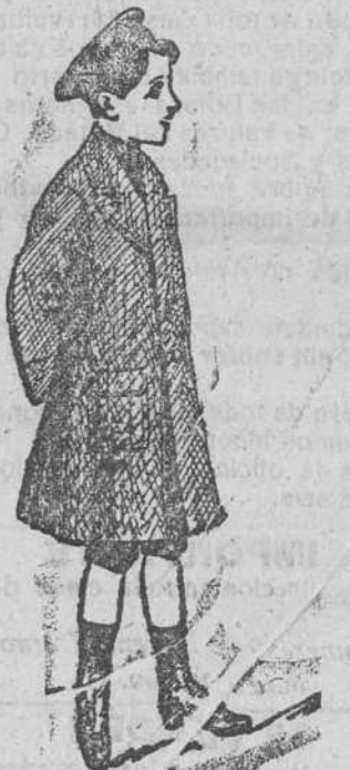
Gabán de paño melton a 25, 30, 40 y 50 pts.