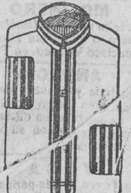
Comisas percal, a 8, 9 y 10 pesetas.

Depósito de las sandalias «Paris», con piso de goma, propias para invierno, y de las máquinas de escribir NOISELESS, completamente silenciosas.