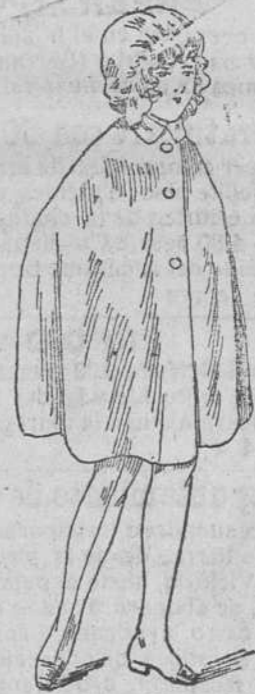
Capitas impermeables, a 10, 12, 15, 20 y 30 pts.