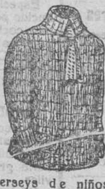
Jerseys de niños con corbata, á 6, 5 y 4'50; sin corbata, á 3, 3'50, 4 y 5 pesetas.

Depósito de las sandalias «Paco», con piso de goma, propias para invierno, y de las máquinas de escribir NOISELESS, completamente silenciosas.