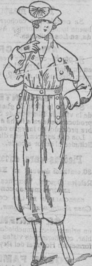
Gebardinas señora á 100, 115, 120 y 125 pesetas.