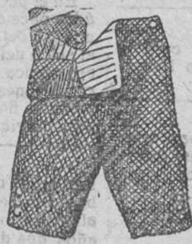
Pantaloncillos cortos de paño y pana á 4, 4'50, 5 y 6 pesetas.