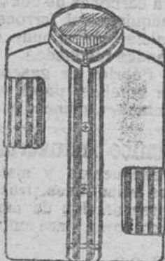
Camisa piqué á 9, 10 y 11 pesetas.