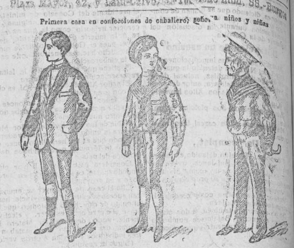
Trejeitos para jóvenes 4 25 30 40 y 50 pesetas. Trejeitos de vicuña 4 15, 18 20 y 25 pesetas. Traje, ton de drill, de pantalón largo, a 28, 30, 35 y 40 pesetas.