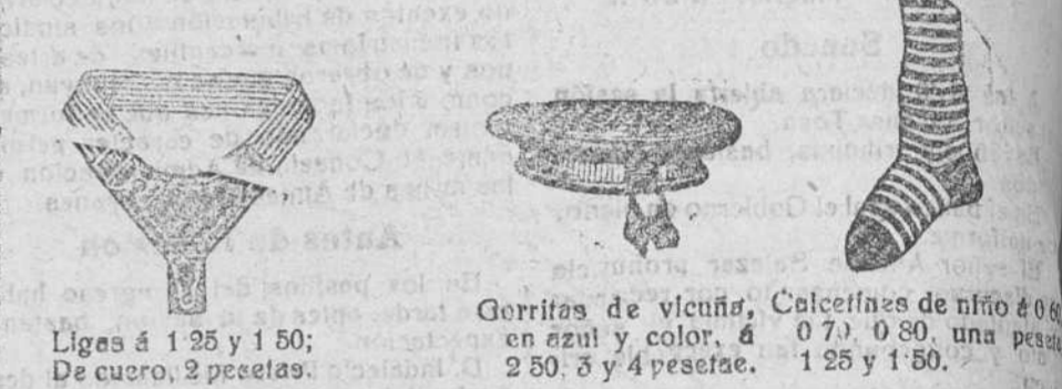
Ligas a 1 25 y 1 50; De cuero, 2 pesetas. Gorritas de vicuña, Calcetines de niño 4 0 0 en azul y color, a 0 7 y 0 80, una peseta 2 50, 3 y 4 pesetas. 1 25 y 1 50.

Depósito de las sandalias «Paco», con piso de goma, propias para lavadero, de las máquinas de escribir NOBLESS, completamente silenciosas. VENTA DE LA CREMA SAPOLI, EL REY DE LOS BETUNES.