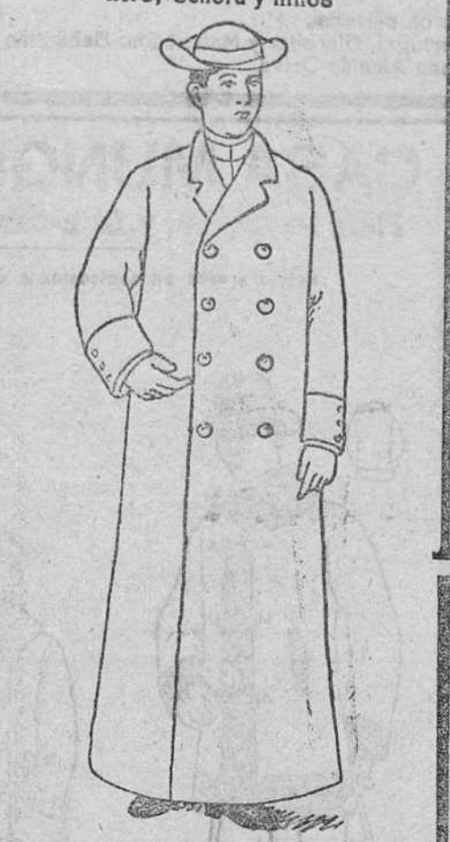
Impermeables para sacerdotes, con capucha, a 26, 28, 30 y 32 duros