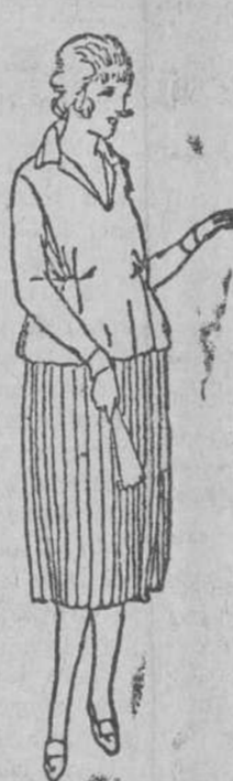
Ve tidos para jovencitos en crepón lana, a 5, 20 y 25 pesetas