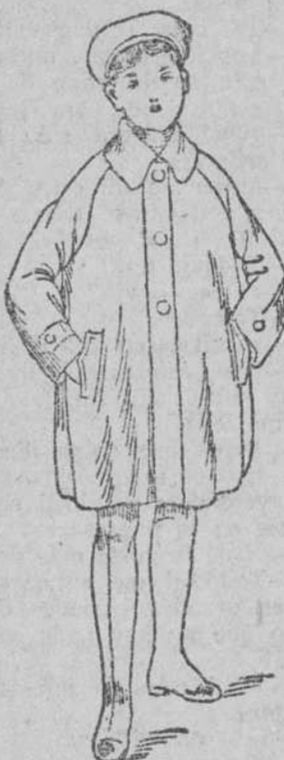
Impermeables, checos, a 18, 20, 25 y 31 pesetas

Siempre grandes existencias encontrarán en