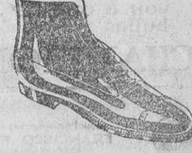
Botas en negro y color, todo cosido 19'50 pesetas