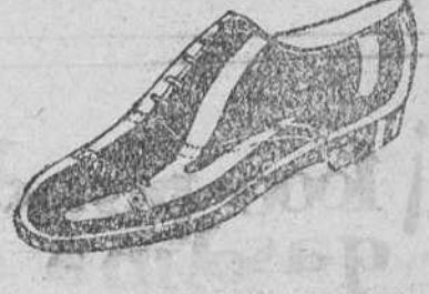
Zapatos en cinco colores distintos 18 pesetas Zapatos de charol 19'50 pesetas