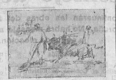
Los toros lidiados ayer arrojaron los pesos siguientes: 1.º 316 kilos, 2.º 269, 3.º 277, 4.º 305, 5.º 308, 6.º 318. Sobrero, 253, o sea un total de 2.046 kilos, que dan un promedio de 278.

porque el público quiere a Marcial, aprecia su valía, conoce su grandeza en el toreo y además se contenta con poco, con excesivamente poco. Ayer gritaron al espada—y en su santo, Marcial—por el gesto de displicencia, por el mohín despreciativo, por la actitud de bravuconería, por su desgana, por su apartamiento de la lidia, pero eso no quiere decir que el público le rechace sistemáticamente. Bien claro pudo verse cuando en su segundo toro dió unos lances suaves, templados, artísticos, de los suyos, y cuando al compás del popular pasodoble que lleva su nombre, clavó