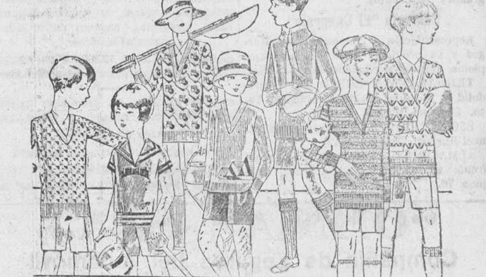
Jerseys y pullover novedad, en lana y algodón, de 4 a 10 pesetas. Modelos y colores novedad. Pantaloncitos cortos de paño, pana, dril y terciopelo.