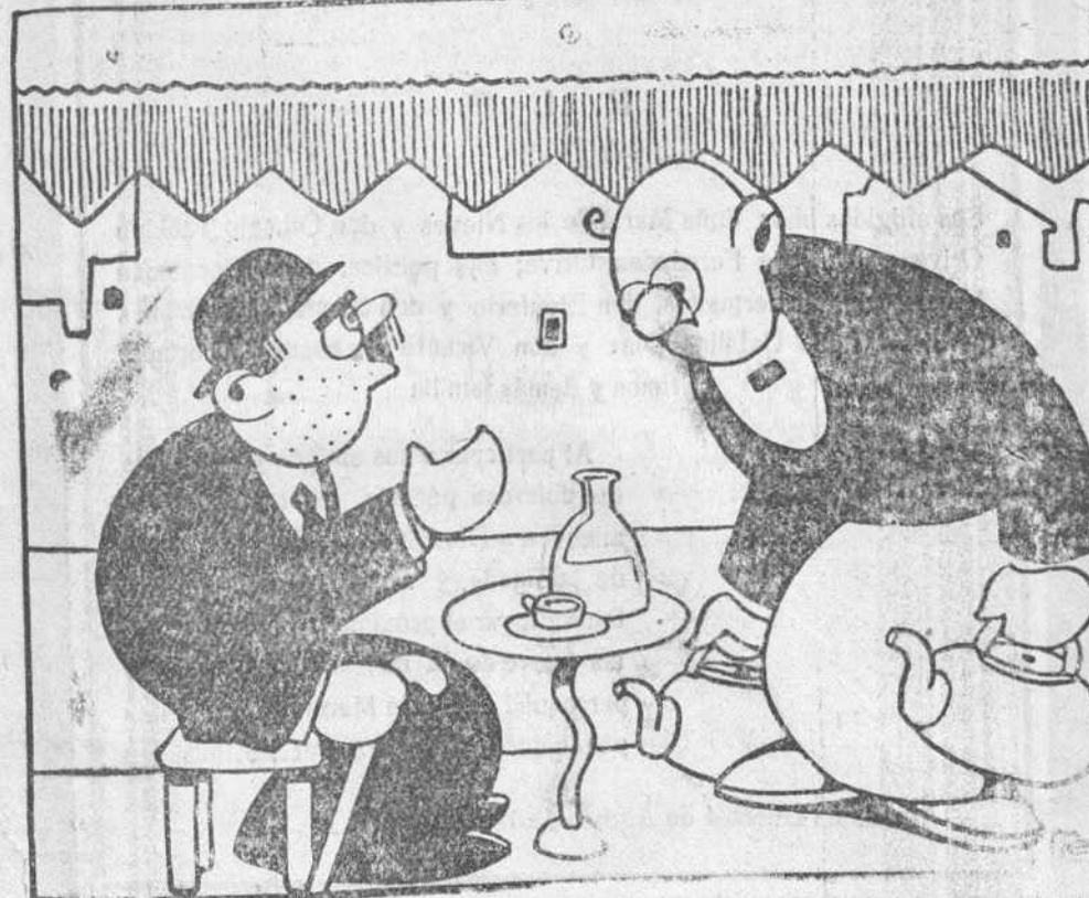
—Tráigame usted una copa de ron. Tengo que hablar en el Congreso y allí hay que tener la voz ronca.

Y dice el señor Quesnay, muy orondo: «Beneficio neto de la reevaluación 11.069 millones. Y esto con la libra hipotéticamente a 40,63. Miréis la mina que se ha encontrado el Banco, ganándose de pronto mil quinientos millones hoy. ¿Cómo no han puesto cogeladoras y levantado arcos y cantado «tedeuums» en loa de estos arbitristas?»