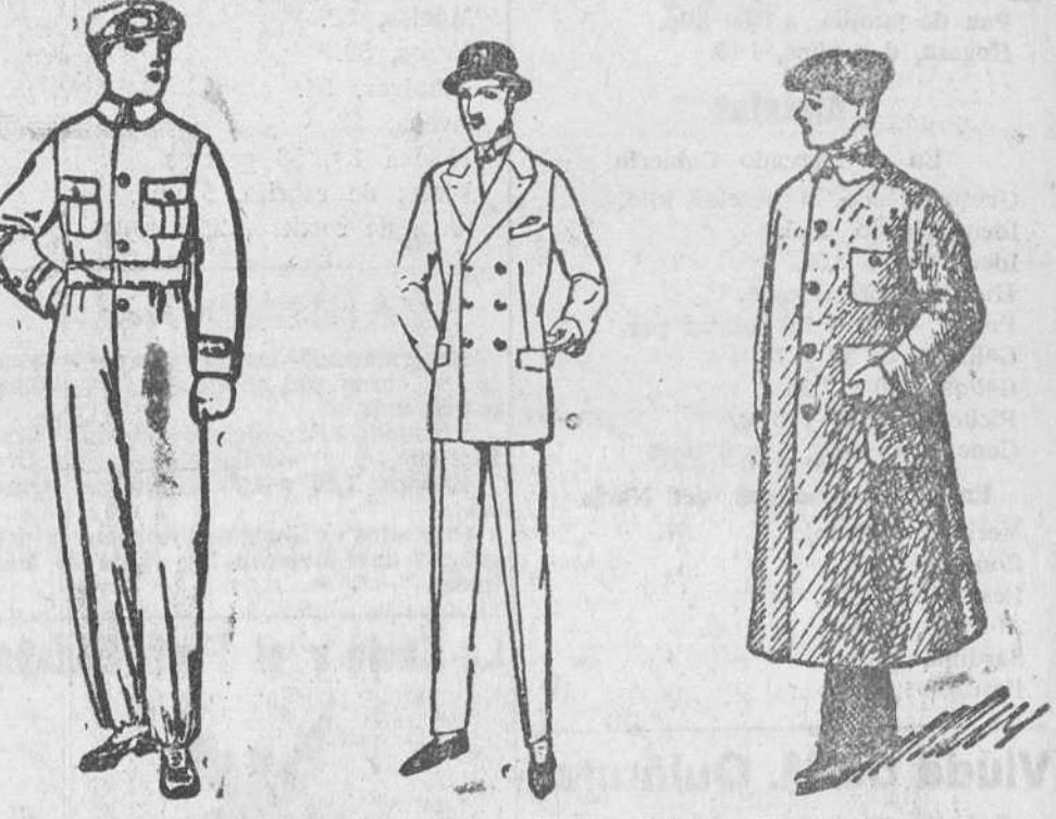
Buzos azules, color kaki y blancos, a 8, 10 y 15 ps. Trajes de confección fina, a 50, 60, 70 y 80 ps. Guardavolvos en color gris y kaki, de 7 a 20 ps.