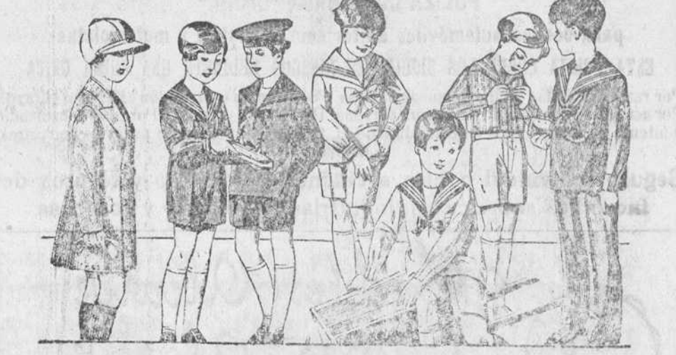
50 modelos distintos en trajecitos para niños, en jergas azules, vicuñas, pañetes y de dril en blanco y color, desde 8 a 35 pesetas. La casa que más surtido presenta y la que más barato vende.