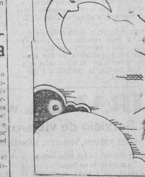
El Sol que más calienta.—¿Has visto cuánta gente se acerca a mí? La luna de Valencia.—¿Lo hacen para no quedarse conmigo?