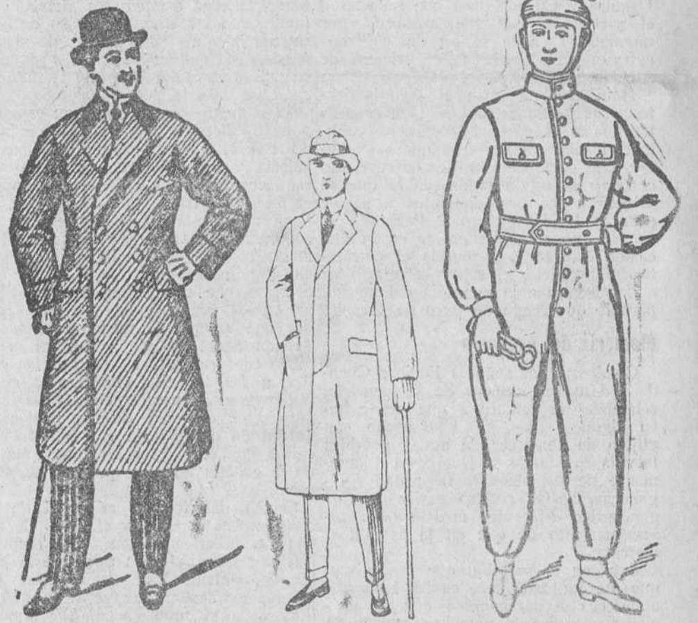
Gabanes col r. dibujo novedad 1, a 60, 70, 80, 90, 100 y 125 pts. Corte mode no Gabanes para jovencito: desde 30 a 75 pts. Buzos azul y kaki a 8, 10, 12, 15, 20 y 23 pts.

Siempre grandes existencias enouradas en la Casa Munguia Plaza Mayor, 42. y Lain-Calvo, 9 y 11 BURGOS