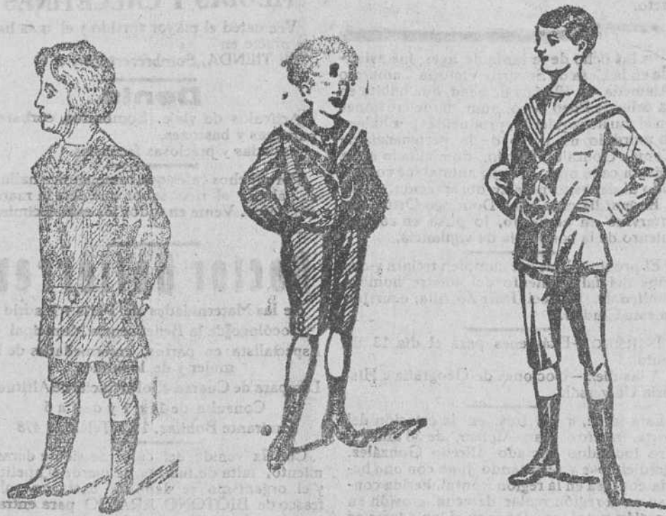
Grandes novedades en trajes de dril, paño y pana, a 8, 10, 15, 25 y 30 pesetas

Gran surtido de trajes, chaquetas y vestimentas de caballeros, señoras y niños.