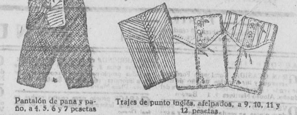
Pantalón de pana y paño, a 4, 5, 6 y 7 pesetas. Trajes de punto inglés, afelpados, a 9, 10, 11 y 12 pesetas.