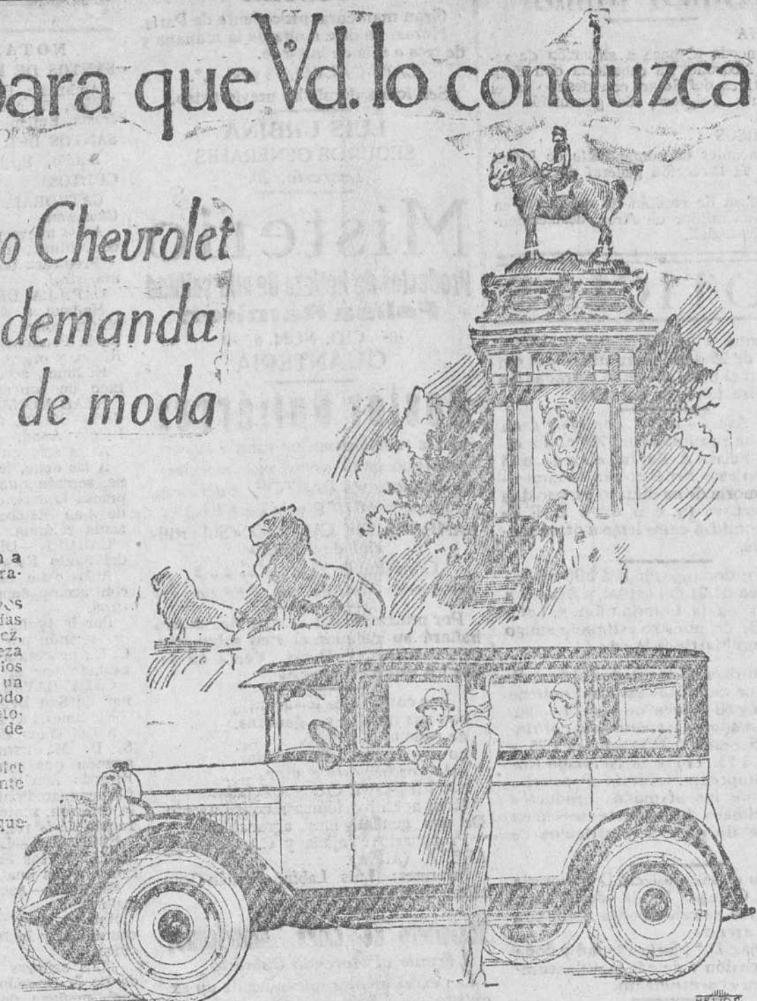
PRODUCTO DE LA GENERAL MOTORS

Tanto en llano como en cuesta el Chevrolet lleva con toda facilidad y comodidad a cinco personas. Debido a