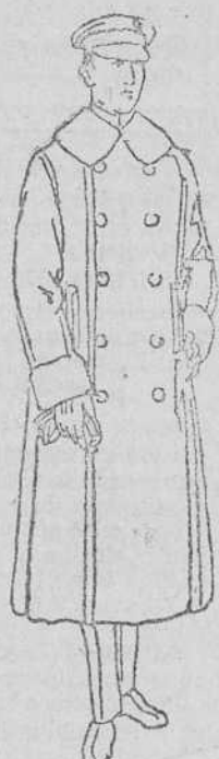
Guardapolvo soffer á 22, 25 y 28 ptas.