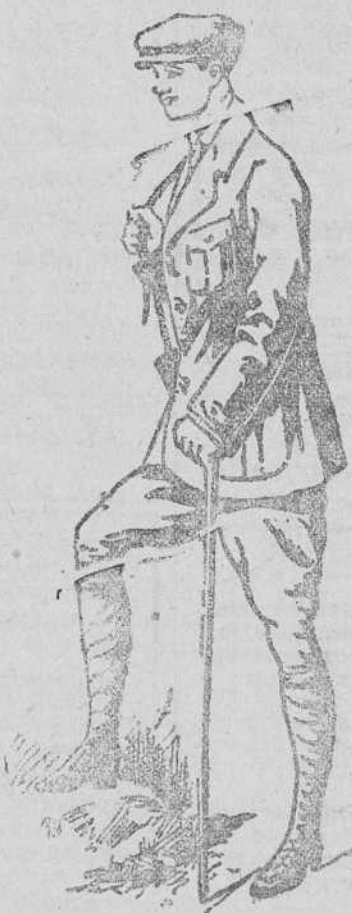
Trajos sport, en paño, pana y dril, desde 35 á 120 pesetas.