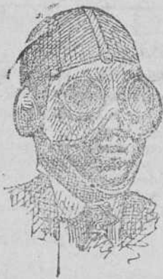
Cascos motoristas, 5, 6 y 7 pts. Gafas á 5 y 6 pesetas.