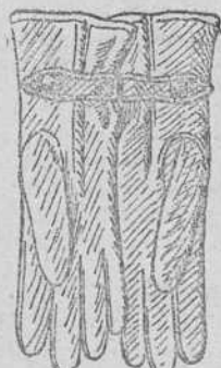
Guantes de piel, á 7, 8, 9 y 10 pesetas.