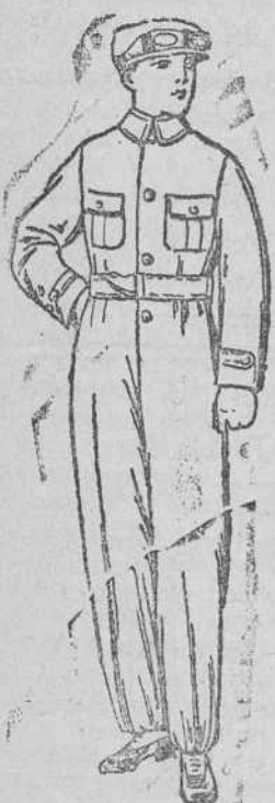
Buzos azules y color kaki, 16, 18, 20 y 25 pts.

Gran casa de tejidos, pañería y colecciones de caballero, señora y niños