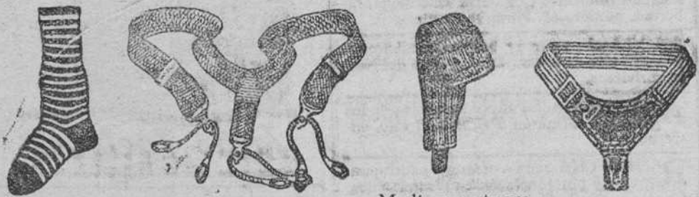
Calcetines caballero á 50 cts. Tirantes á 1'25, 1'50, 2'50 niños, desde 3'50 Ligas á 0'50, 1, 1'50 y 3 pesetas. Medias sport para hombre á 6 pesetas y 2 para niño