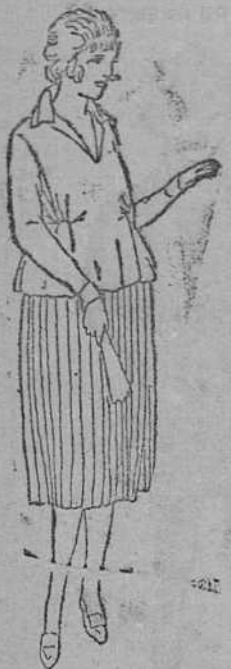
Blusa punto seda á 35, 40 y 50 pts. Faldas pilsadas á 30, 35 y 40 pts.

En esta sección de señoras y niñas, encontrarán siempre los últimos modelos en vestidos enteros y de levitá, en todos los colores, clases y estilos.