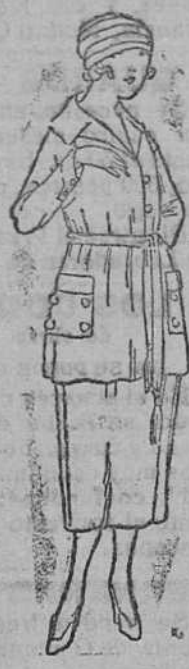
Vestidos de levitá y falda, en lana, á 45, 50, 60, 70 y 80 pts.