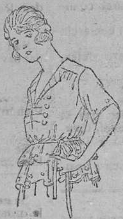
Blusas de punto, en diversidad de colores, 14, 18, 16, 20 y 25 pts.