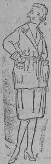
Trajecitos para jóvenes, en algodón, á 30 y 35 pts.