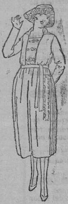
Vestidos enteros, en lana y color, á 35, 40, 45, 50 y 55 pts.