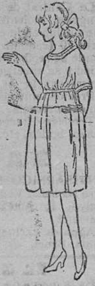
Vestidos para niñas en lana, á 14, 16, 18, 20, 25 pts. Modelos novedad

LA EXPERIENCIA DEMUESTRA QUE LOS CHOCOLATES Y DULCES