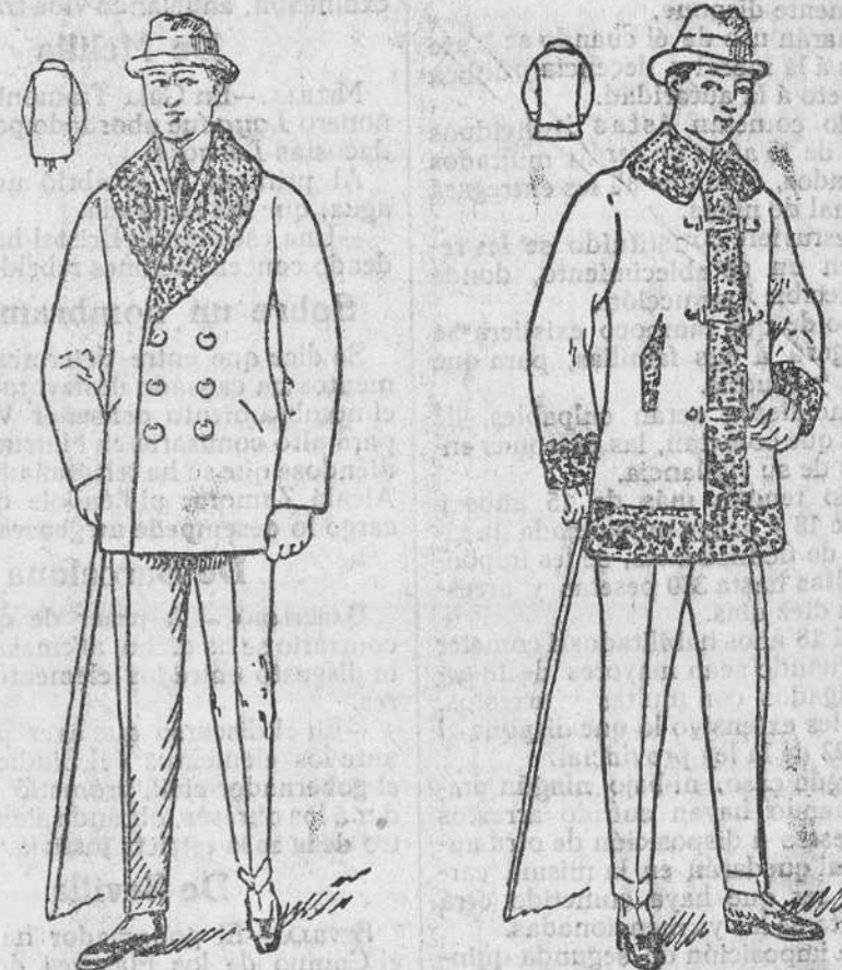
Pelizas paño pluma, rizo al cuello, de 25 á 100 pesetas

Gran casa de tejidos, pañería y confecciones de caballero, señora y niños