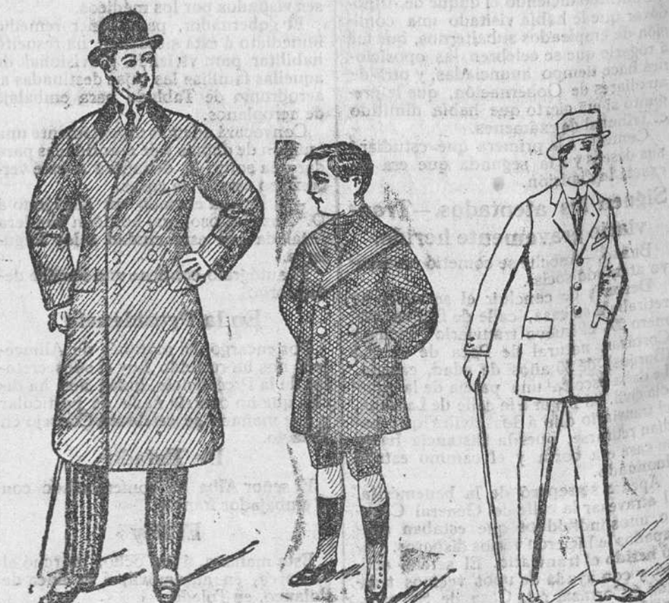
Gabanes de caballero de 60 á 120 pesetas Abriguitos de niños desde 20 á 60 ptas. Trajes caballero, esmerada confección, de 45 á 150 ps. Siempre en esta casa encontrarán grandes surtidos en toda clase de prendas hechas

El remedio más racional para las enfermedades del aparato respiratorio es la inhalación anti-séptica y balsámica que se produce al disolverse en la boca las PASTILLAS MORELLÓ Curan y evitan los RESFRIADOS, ASMA, TOS, BRONQUITIS, etc. Su uso está libre de peligros hasta para los niños y personas de edad avanzada.