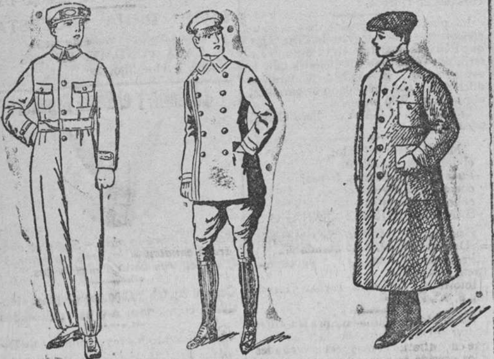
Buzos azules para mecánicos y motoristas, a 14, 15, 16, 18 y 20 pesetas

Gran casa de tejidos, pañería y confecciones de caballero, señora y niños