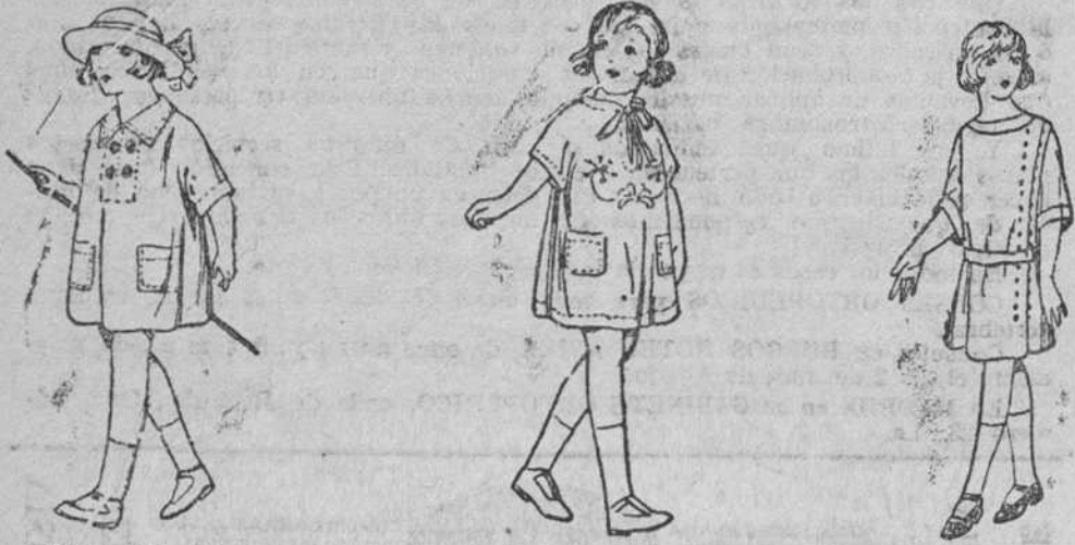
Diversidad de modelos en vestiditos de percal y batista, 2'50 a 10 pesetas.

Gran casa de tejidos, pañería y confecciones de caballero, señora y niños