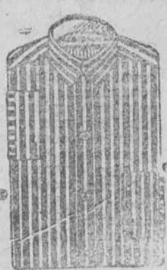
Camisas pechera otomán seda, 7, 8, 9 y 10.