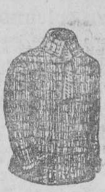
Jerseys de caballero a 4, 5, 6 y 7 pesetas