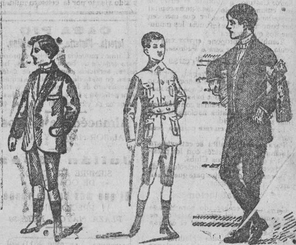
Trajes de paño dril, para jovencitos, a 25, 30, 35 y 40 pesetas. Trajecitos de dril a 8, 10, 15 y 20 pesetas. Trajes blancos para primera comunión, de alpaca lana y gerga.—Precios según clase

Gran casa de tejidos, pañería y confecciones de caballero, señora y niño.