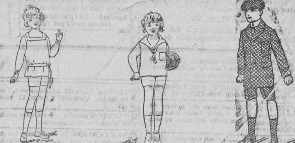
Trajecitos punto a 9, 10, 12 y 15 ptas. Trajecitos dril, en blanco y color, a 12, 15, 18 y 20 pts. Trajecito cuadros, gran novedad, a 20, 25 y 30 pesetas