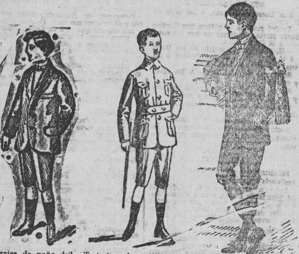
Trajes de paño dril, para jovencitos, a 25, 30, 35 y 40 pesetas

Gran casa de tejidos, pañería y confecciones de caballero, señora y niños