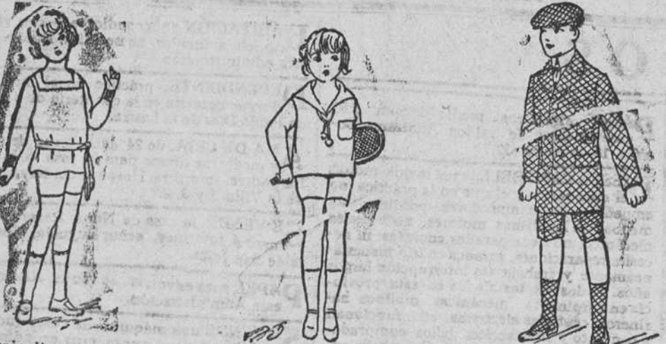
Trajecitos punto a 9, 10, 12 y 15 pts.