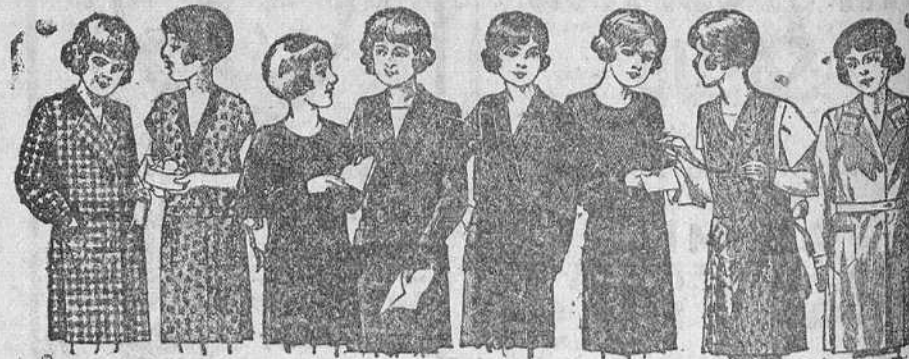
Vestiditos para niñas de 8 a 14 años, en crepón, seda o lana, de 12, 15, 18, 20 y 25 pesetas. La Casa que más surtido presenta y más barato vende