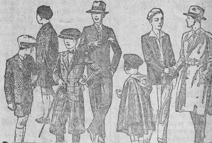
Abrigos y trajes de paño, modelos nuevos de 20, 25, 30, 35, 40 y 50 pesetas