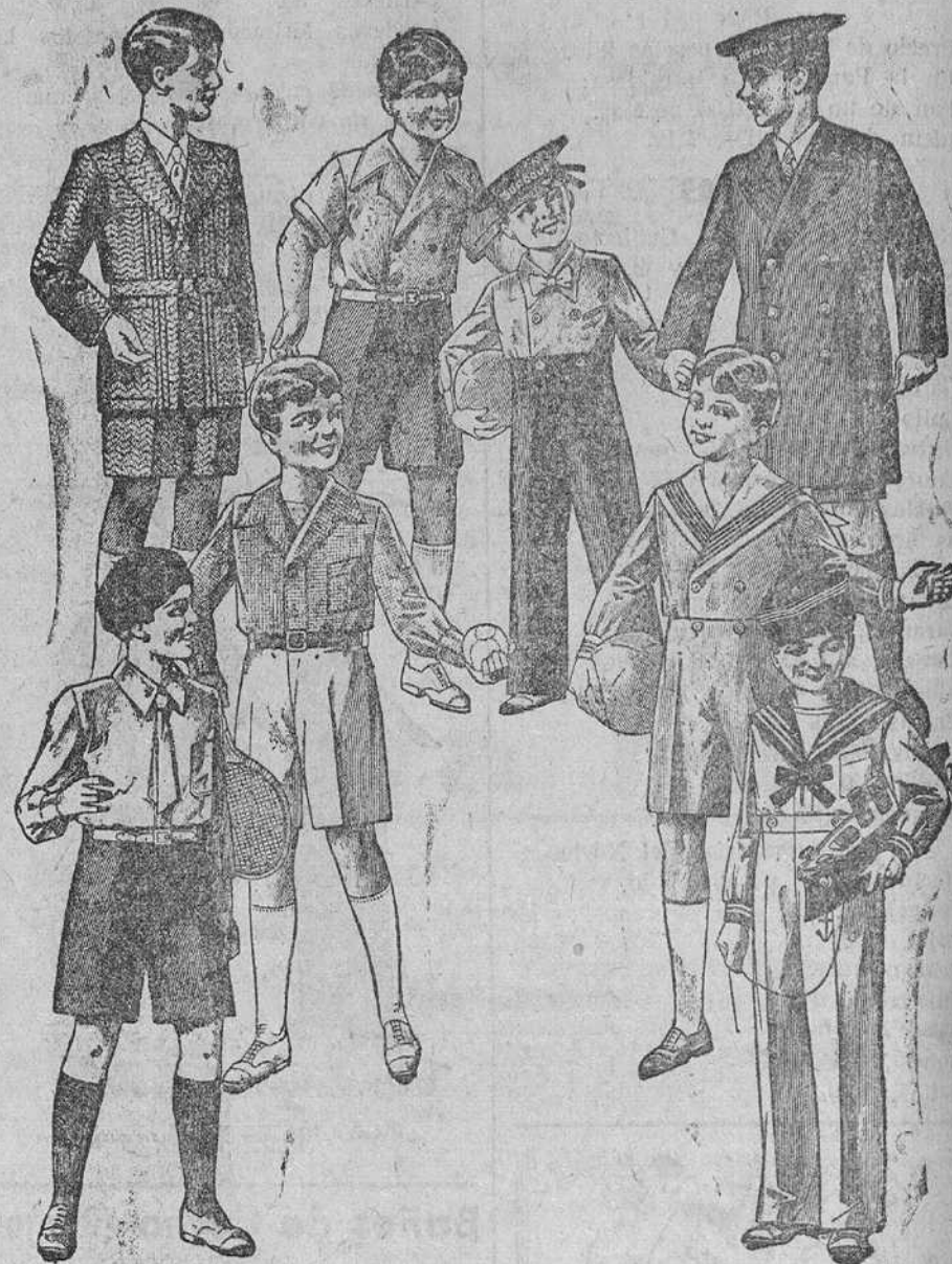
Trajecitos, modelos novedad, de 15, 18, 20, 25 y 30 pesetas

Primera casa en confecciones para caballero, señora y niños Plaza Mayor, 42. Lato-Calvo, 9 y 11.--Sucursal: Plaza Mayor, 6, Burgos