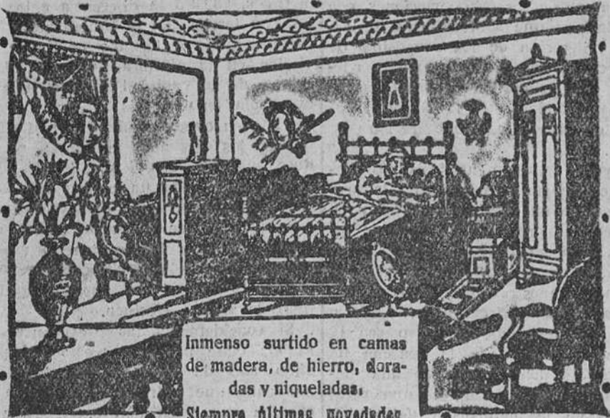
Inmenso surtido en camas de madera, de hierro, doradas y niqueladas. Siempre últimas novedades.

Calle de Vitoria, número 14.--BURGOS En esta Casa se vende el sommier "Numancia"