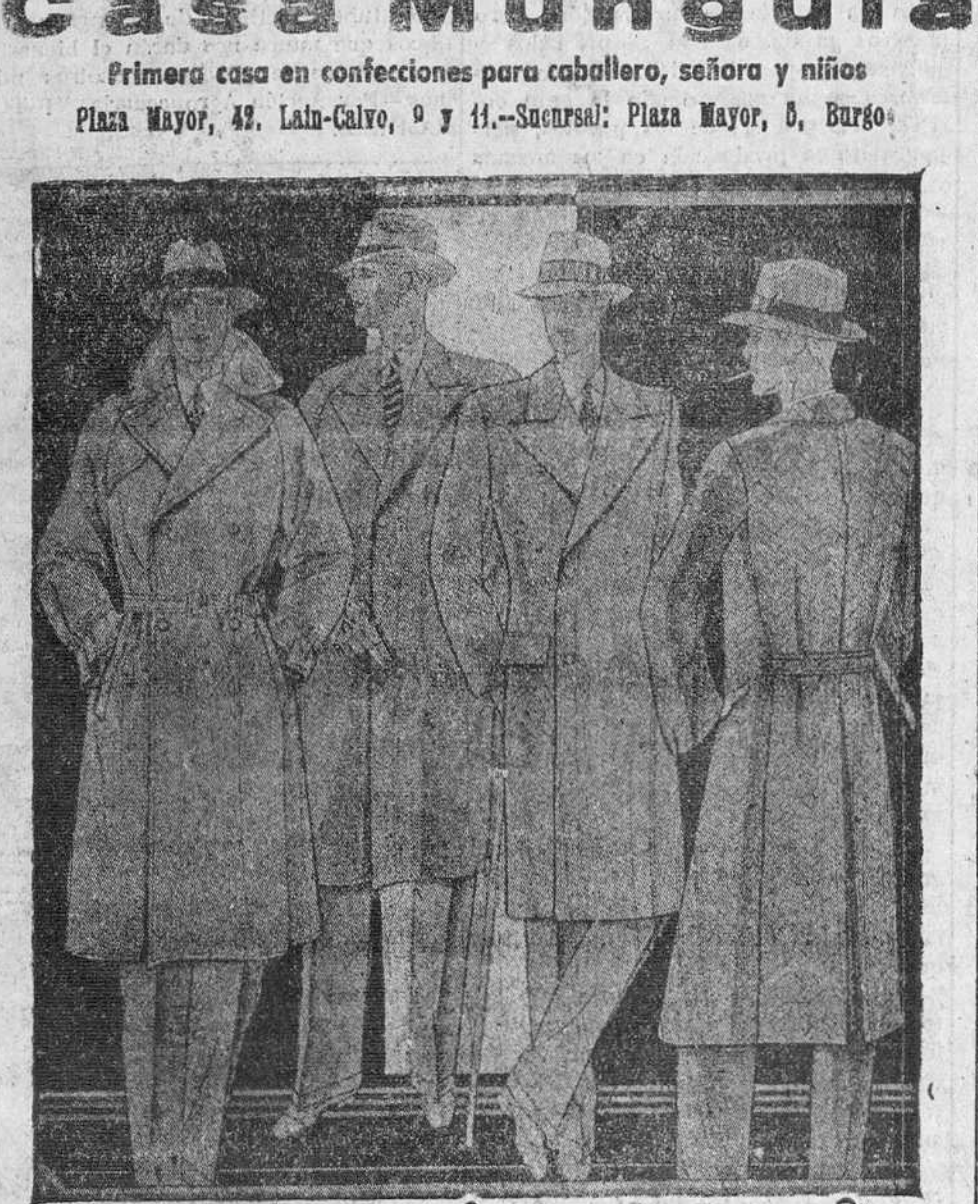
Abrigos novedad, corte moderno desde 35 pesetas a 200 uno. Colores y dibujos modernos.

Plaza Mayor, 42. Lahu-calvo, 9 y 11.-Sociedad: Plaza Mayor, 5, Burgos