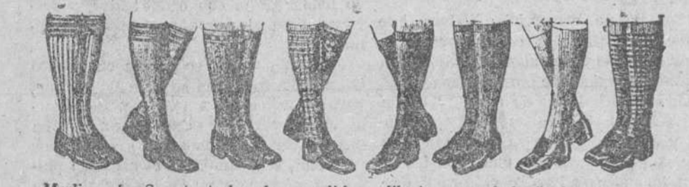
Medias de Sport, todas las medidas, dibujos novedad, de 1 a 5 pesetas. 1.00 jerseys con cremallera para niños, de 3 a 10 pesetas.

La Casa que más surtido presenta y más barato vende