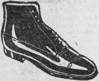
BOTAS Todo cosido! a 19'50 pesetas