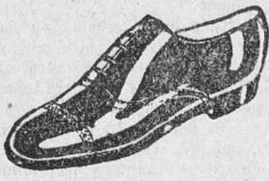
ZAPATOS Los mejores—Ultimos modelos a 18 pesetas