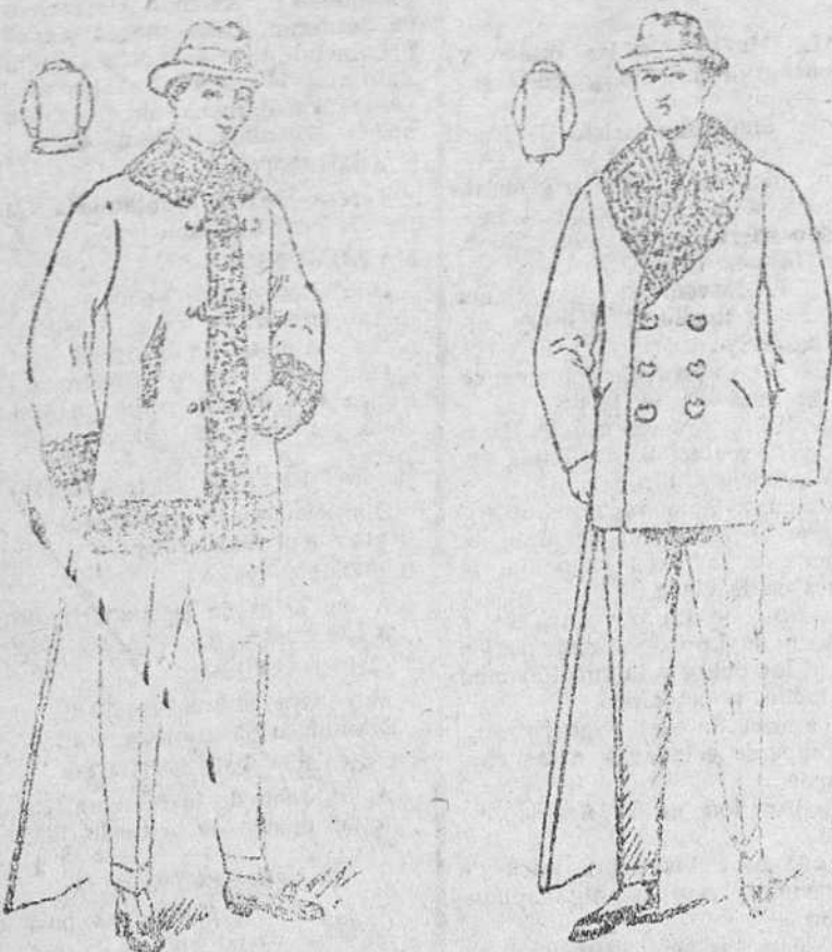
Pelizas de paño melton y castor, a 17, 20, 25, 30, 40, 60 y 100 pesetas

Casa de teleros, pañeros y confeccionados de caballeros, señoras y niños.