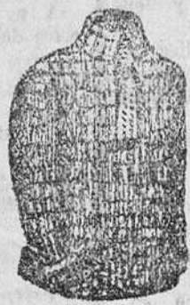
Jersey lana y algodón, a 4, 5, 6 y 7 pesetas.