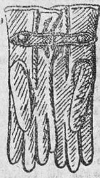
Guantes piel, a 8, 10 y 12 pesetas