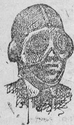
Pasamontañas de lana, a 4 y 5 pesetas. Gafas, a 3, 3'50 y 4 pesetas.