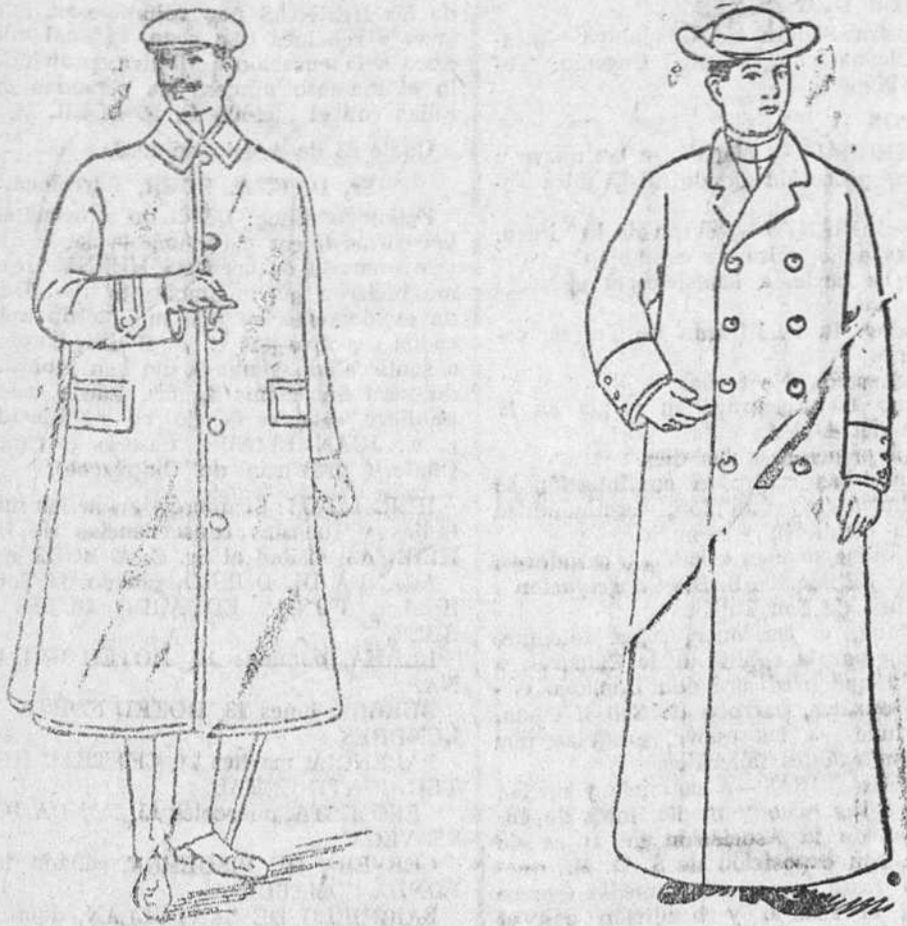
Guardapolvos a 7, 8 y 10 pesetas. Guardapolvos de satén y dril.

Gran surtido de tejidos, paños y confecciones de caballero, señora y niños