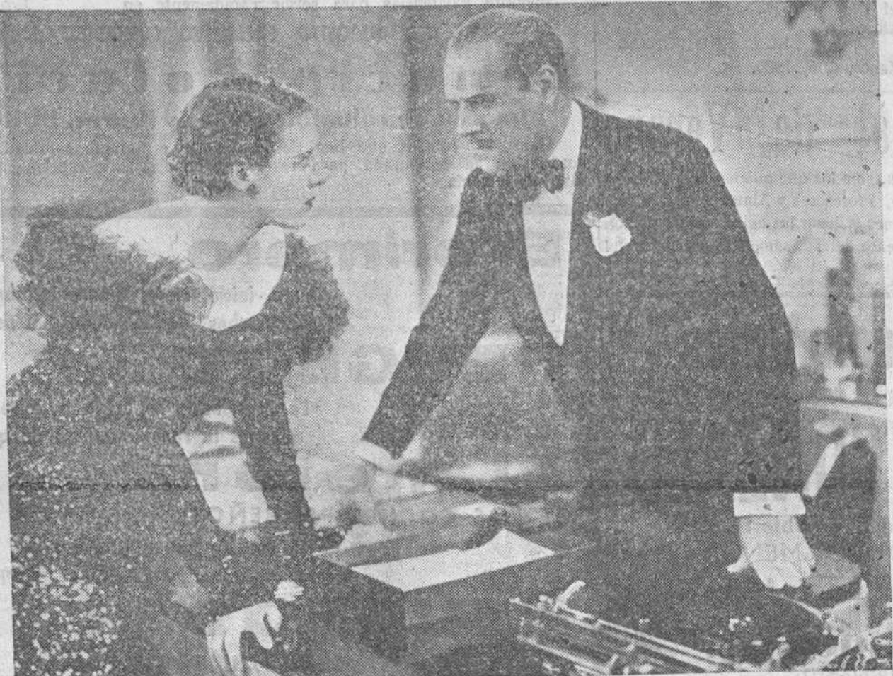
Una escena de la película Columbia "El Remolino", que distribuye Cifesa