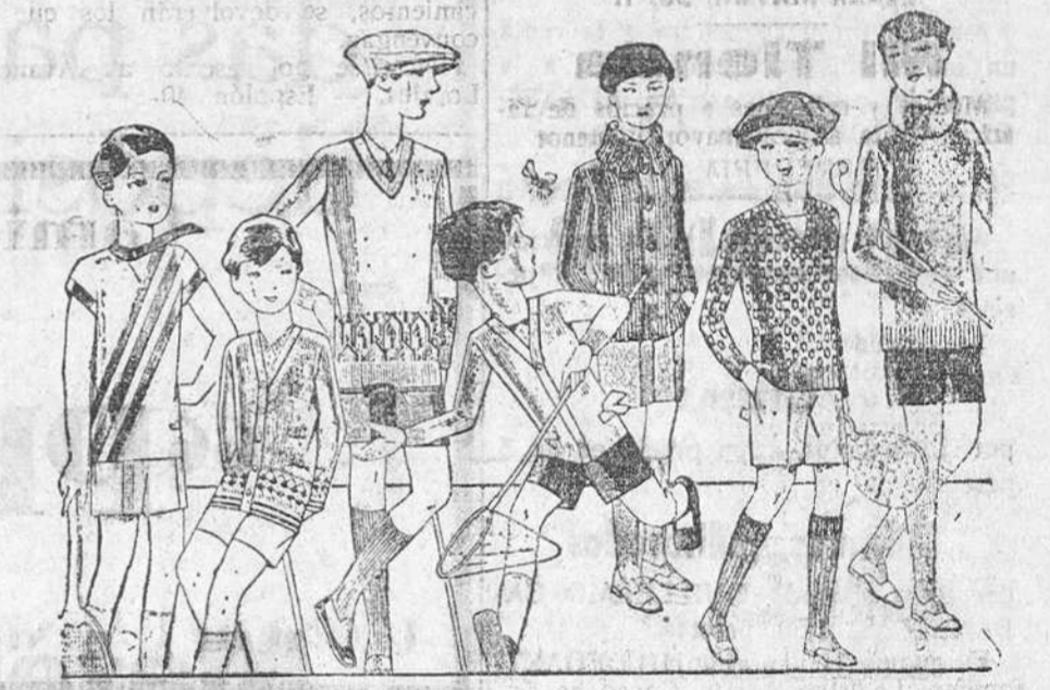
Jerseys punto, para niño, diversidad de dibujos y colores A 4, 5, 6, 7, 8 y 10 pesetas

Primera casa en tejidos y confecciones para caballero, señora, jóvenes y niños