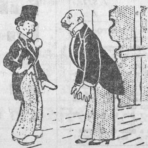
El director de escena al actor.—¡Es imposible! ¿Cómo va usted a hacer el papel de borracho si viene así todas las noches?

Ya se han abierto las hoyas en los terrenos comprendidos entre el «Dos de Mayo» y «San Roque».