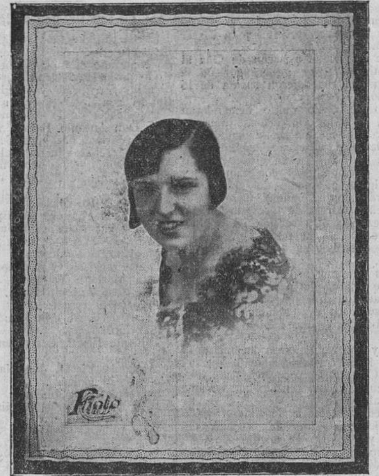
Lema: «Mir-flor», cuarta belleza del concurso

Juventud, divino tesoro; qué gran gran verdad es, nos lo demuestra la encantadora modistilla que firma el lema «Mir-flor».