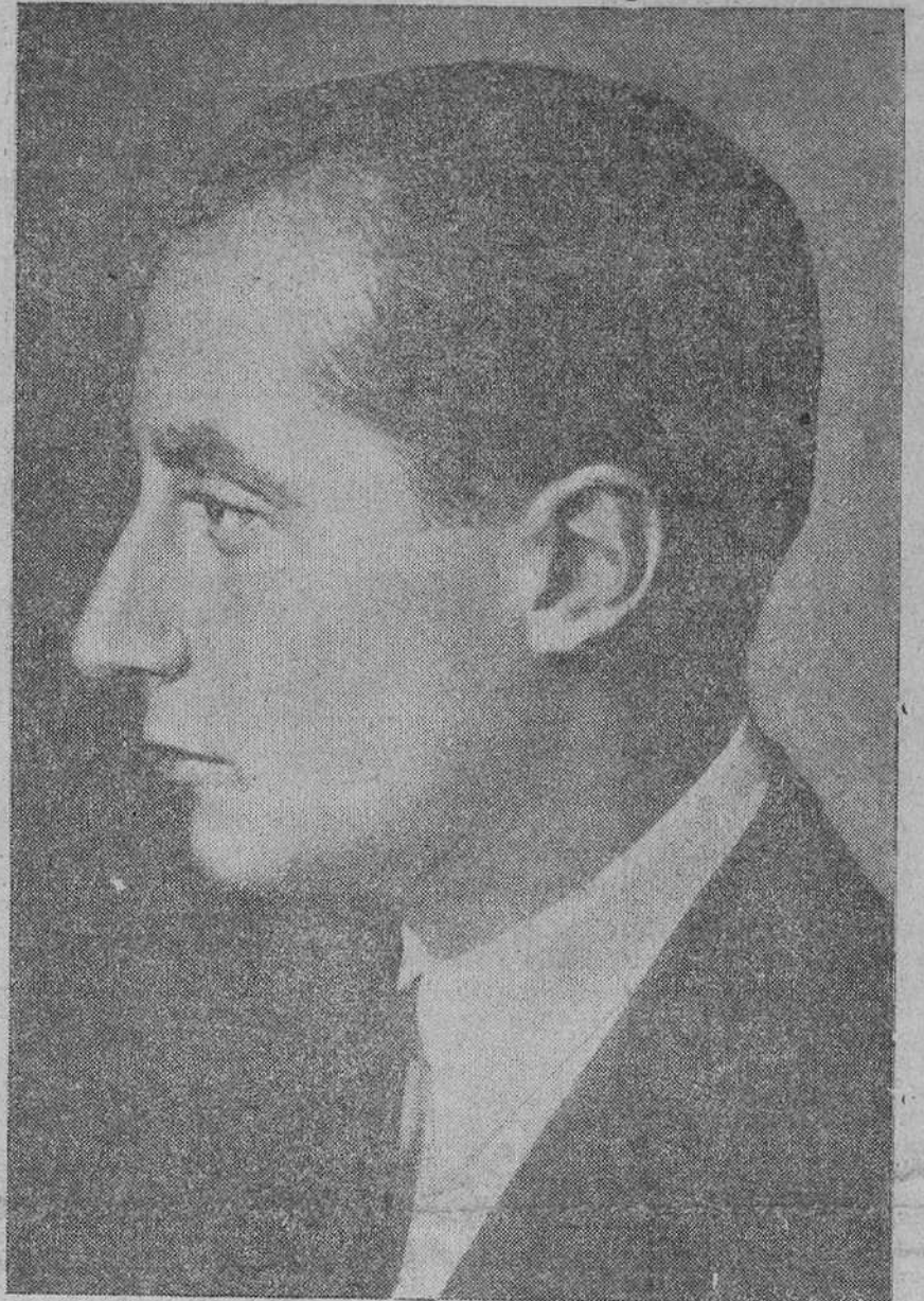
José Antonio, héroe y mártir sin par de la Cruzada Salvadora