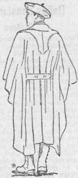
Capote confeccionado con paño de primera 57 pesetas.