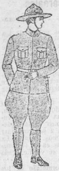
Trajes de paños de primera. 43 pesetas.