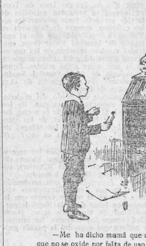
—Me ha dicho mamá que dé usted con esto al aparato, para que no se oxide por falta de uso.

Regresó a su medida, para almorzar aquí, saliendo para Madrid en el rápido.