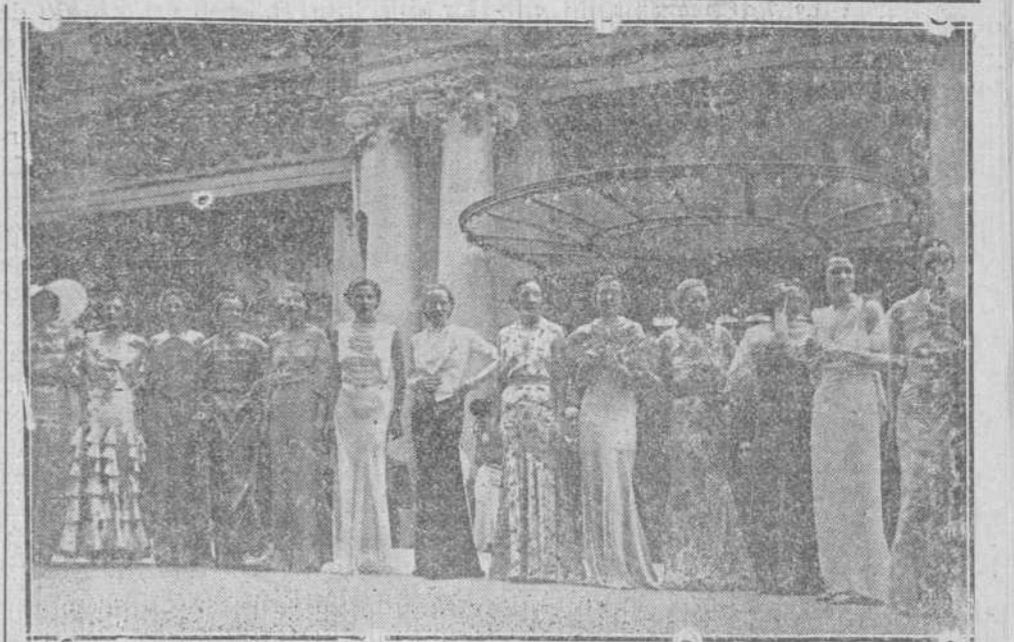
LOS MAS BELLOS MANIQUIES DE PARIS. En el Gran Prado de París, ha tenido lugar ante una numerosa y elegante concurrencia, la elección de las señoritas maniqués más bellas y elegantes de París. Desfile de las maniqués.