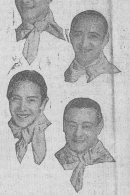
El conjunto argentino «Los Pampeanos», afamados intérpretes del folklore sudamericano, que el sábado, y el domingo actuarán, como fin de fiesta, en el Teatro Principal.

AÑO CRISTIANO , por Fray Justo Pérez de Urbel, Benedictino de Silos, Tomo II—Ediciones Fax, Madrid.