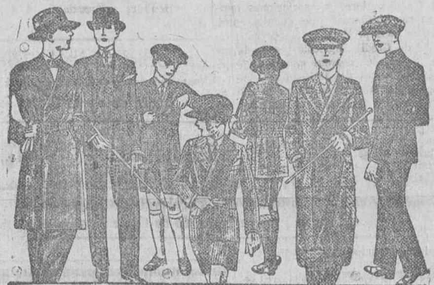
TRAJES para mocetes todos los gustos, edad de 10 a 16 años, a 30, 40, 50 y 70 pesetas. TRAJES, pantalón nikel, desde 35 a 75 pesetas. La casa que más barato vende y más surtido presenta