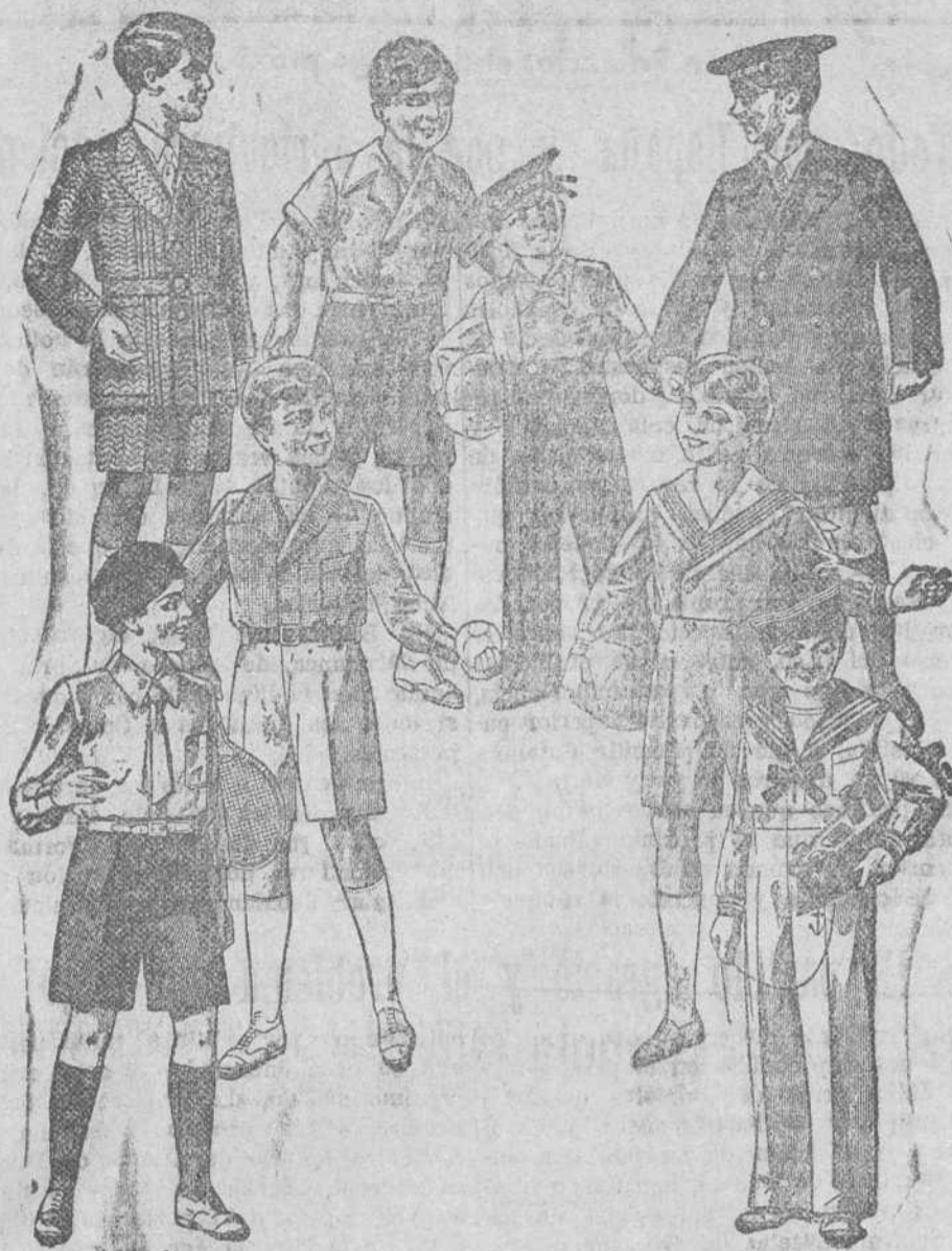
20 modelos distintos de trajecitos de 15. 20. 25, 30, 40 y 50 pesetas. Modelos novedad - Siempre grandes surtidos

Primera casa en tejidos y confecciones para caballero, señora, jóvenes y niños PAÑERIAS - SASTRERIAS - CALZADOS SEGARRA Plaza Mayor, 42, LAIN-CALVO, 9 y 11.-Sucursal: Plaza Mayor, 8, Burgos