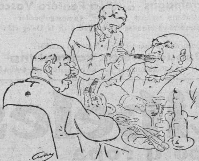
—Si no hubiera cigarras, no sabría uno cuando ha acabado de comer.