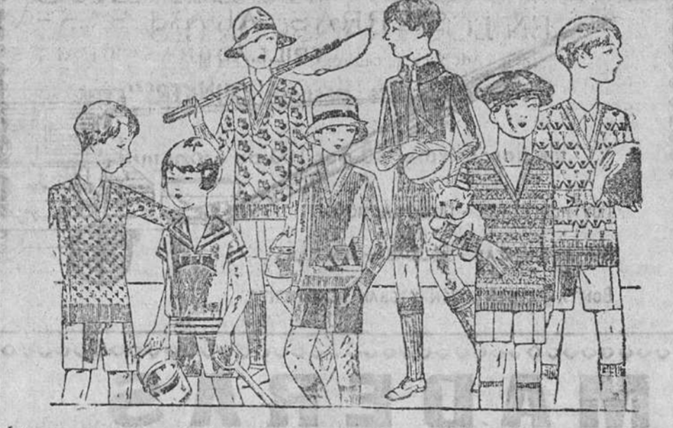
Jerseys para niños, de todos los tamaños, diversidad de dibujos y colores, a 3, 3'50, 4, 5, 6, 8, 9 y 10 pesetas

Primera casa en tejidos y confecciones para caballero, señora, jóvenes y niños PAÑERÍAS - SASTRERÍAS - CALZADOS SEGARRA Plaza Mayor, 42, Lain Calvo, 9 y 11.—Sucursal: Plaza Mayor, 5, Burgos