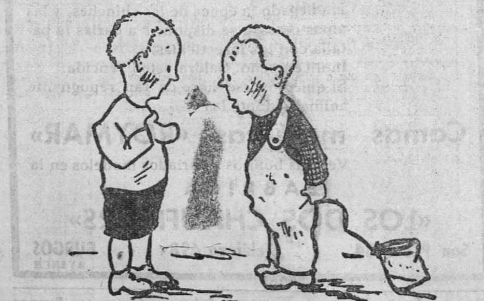
Y por qué te ha sacado el dentista dos muelas en vez de una? —Porque no tenía bastante suelto para darme la vuelta.

EN SEPTA PAGINA ANUNCIOS DE ESPECTACULOS