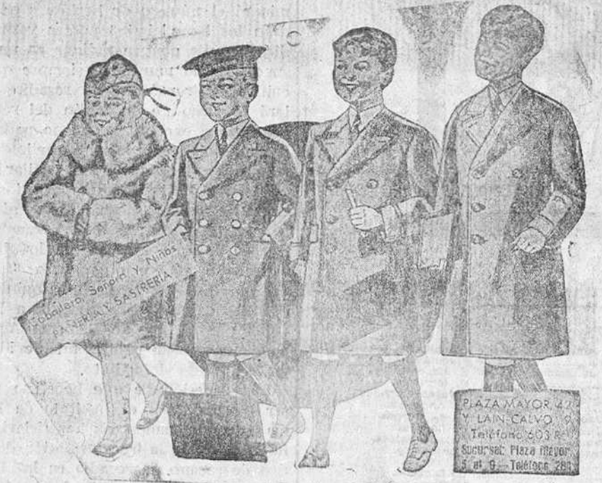
Abriguitos para niños, modelos novedad, de 15, 18, 20, 25 y 30 pesetas.

Impresión blanca e Impresión Hecho en la Administración de este periódico