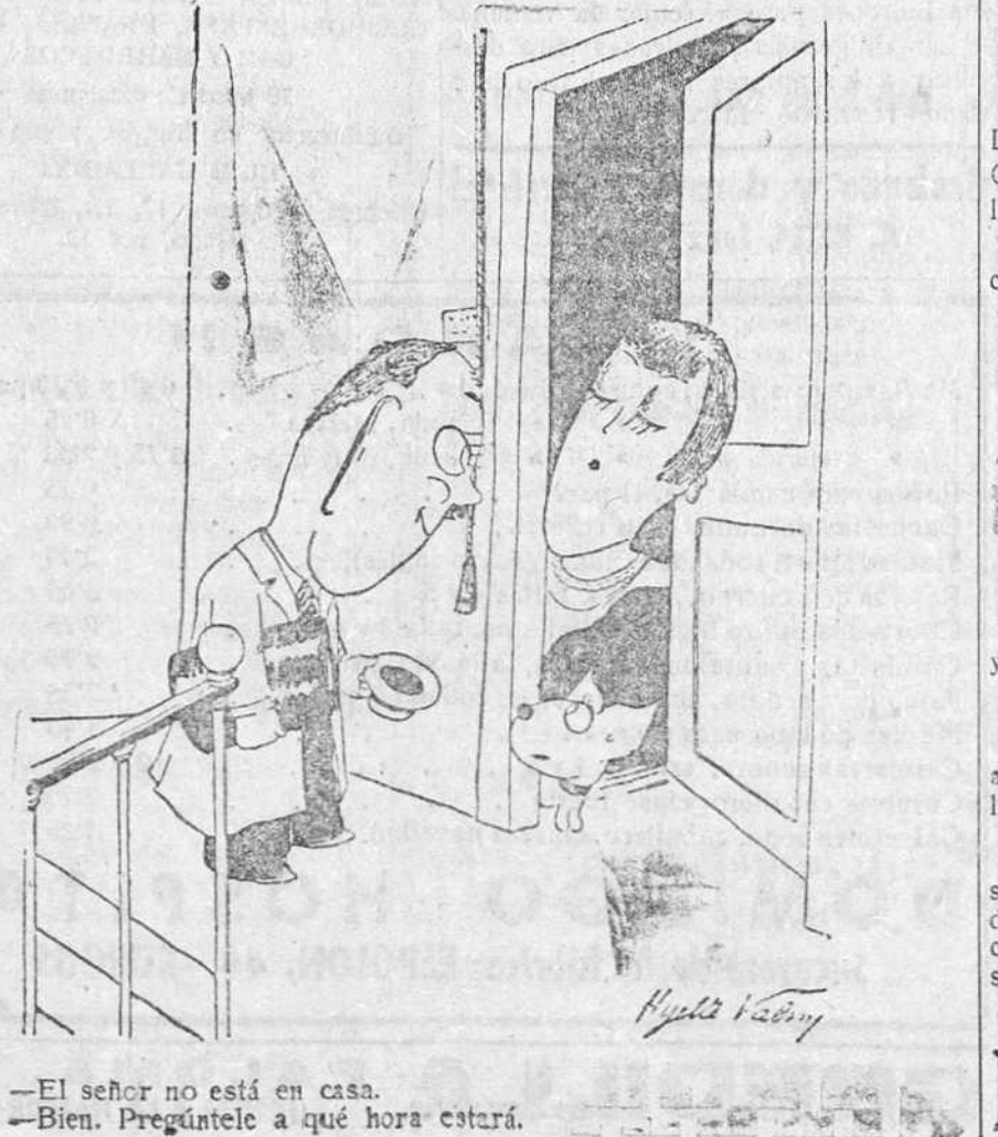
—El señor no está en casa. —Bien. Pregúntele a qué hora estará.