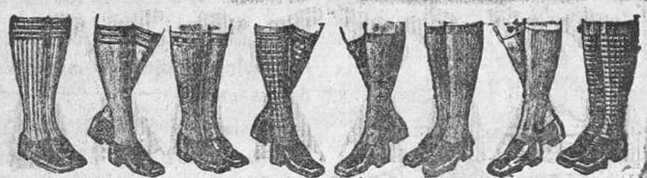
Medias de Sport, todas las medidas, dibujos novedad, de 1 a 5 pesetas. 1,00 jerseys con cremallera para niños, de 3 a 10 pesetas.

La Casa que más surtido presenta y más barato vende