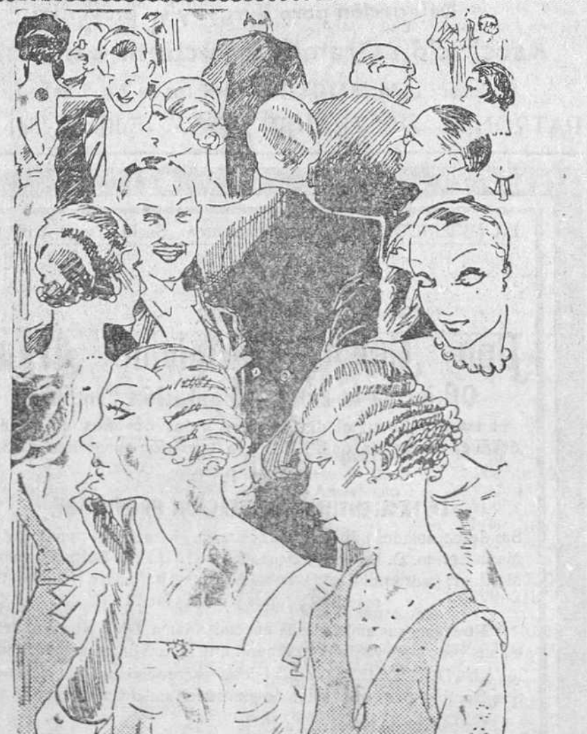
Hace diez minutos que busco a mi marido. La señorita. — ¡Y yo hace veinte años que busco al mío!