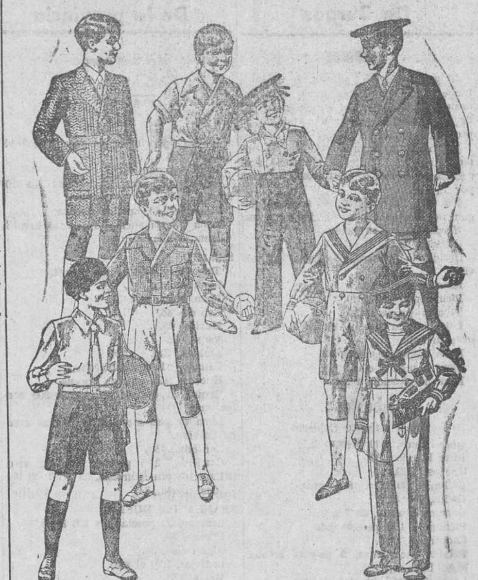
20 modelos distintos de trajecitos de 15, 20, 25, 30, 40 y 50 pesetas. Modelos novedad - Siempre grandes surtidos

Primera casa en tejidos y confecciones para caballero, señora, jóvenes y niños PAÑERIAS - SASTRERIAS - CALZADOS SEGARRA Plaza Mayor, 43, Lain-Calvo, 9 y 11. - Sucursal: Plaza Mayor, 6, Burgos