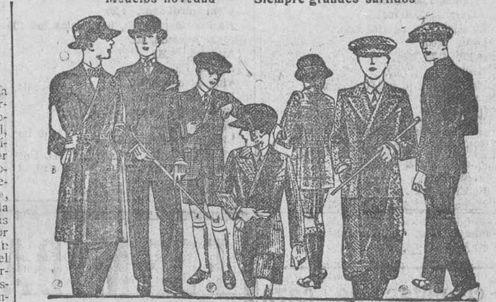
TRAJES para mocetes todos los gustos, edad de 10 a 16 años a 30, 40, 50 60 y 70 pesetas. TRAJES, pantalón nikel, desde 35 a 75 pesetas.

La casa que más barato vende y más surtido presenta