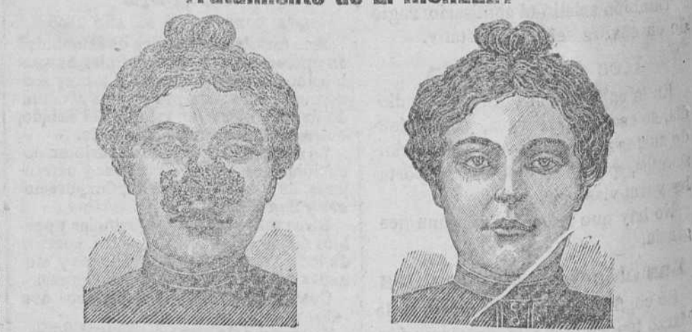
Antes de la curación A los 15 días de tratamiento