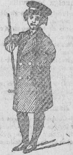
Matelos y gabancitos para niños, de ptas. 12 á 40.

50 modelos diferentes en trajecitos de paño y pana para niños