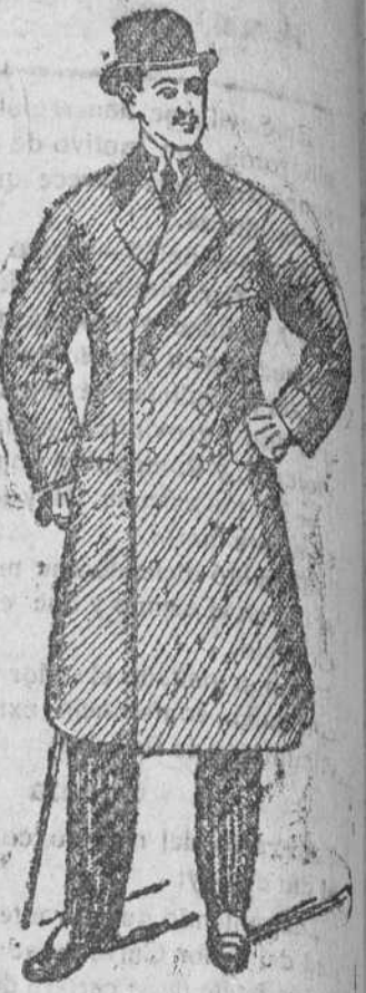
Gabanes desde pesetas 30 á 125

En forma entallada, hay seis modelos diferentes, á 80 ptas.