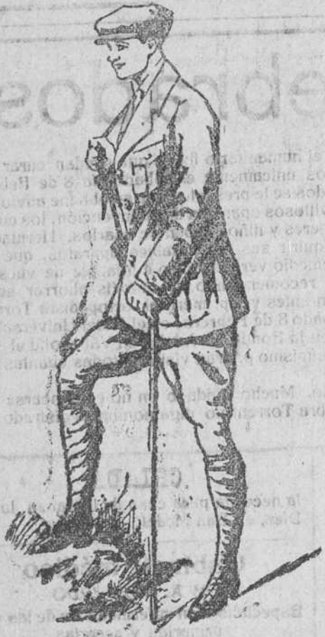
Traje sport, en paño y pana

Única casa que presenta grandes surtidos en tejidos y ropas confeccionadas de caballero, señora y niños