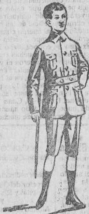
Trajecitos sport, en paño y pana

Trajes para jovencitos, en paño y pana, á precios muy baratos.