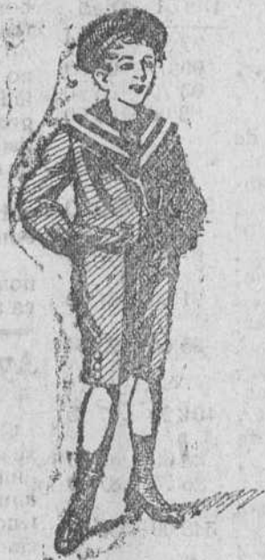
Trajecitos en paño, pana, gerga y drill

Abrigos niña, con cuellos piel, á 15 y 25 pesetas.