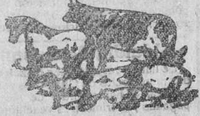
Antes de tomar El Engorde Castellano de Liras , hay ganado anémico, sin apetito, hace malas digestiones, enferman.